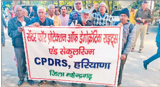
नारनौल। लघु सचिवालय में प्रदर्शन करते संगठनों के सदस्य तथा बैठक के दौरान संघ के पदाधिकारी।

धर्मनिरपेक्षता हमारे संविधान की मूल निरपेक्षता है, सरकारें लगातार धर्मनिरपेक्षता की अवधारणा को कमजोर करती आ रही है। जिससे भारत की बहुलतावादी संस्कृति खतरे में है।