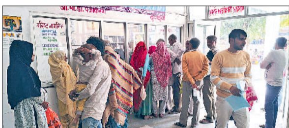
मंडी अटेली। अस्पताल में काउंटर से ओपीडी की पर्ची कटवाते मरीज।