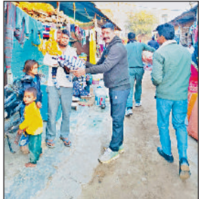
नारनौल। केबल वितरित करते रोटरी क्लब रॉयल्स के सदस्य।