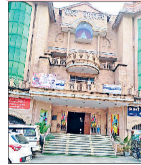
यादव सभा भवन