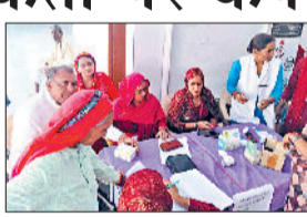
महेंद्रगढ़। मरीजों की जांच करते हुए।