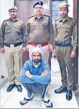
नारनौल। पुलिस गिरफ्त में आरोपित।

भारतीय दूतावास व सेना के सहयोग से रेस्क्यू ऑपरेशन के बाद पीड़ित सुरक्षित वापस लौटे