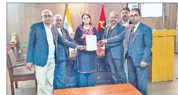
नारनौल। एसपी को शिकायत सौंपते श्रीगौड़ ब्राह्मण सभा के सदस्य।