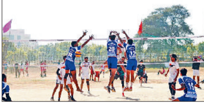
महेन्द्रगढ़। प्रतियोगिता में दमखम दिखाते खिलाड़ी।

हरियाणा केंद्रीय विश्वविद्यालय में आयोजित किए जा रहे चार दिवसीय उत्तर क्षेत्र अंतर-विश्वविद्यालय वॉलीबॉल (पुरुष) प्रतियोगिता 2025-26 के दूसरे दिन विभिन्न प्रतिभागी टीमों के द्वारा रोमांचक खेल का प्रदर्शन किया गया। इन मुकाबलों की शुरुआत गुरु अमंद देव पशु विज्ञान एवं चिकित्सा व राजा महेंद्र प्रताप सिंह विश्वविद्यालय अलीगढ़ के साथ हुई। इसमें राजा महेंद्र प्रताप सिंह विश्वविद्यालय, अलीगढ़ की टीम में बाजी मारी। इसी क्रम में प्रतियोगिता के दूसरे दिन महर्षि दयानंद विश्वविद्यालय (एमडीयू) रोहतक व चण्डीगढ़ विश्वविद्यालय मोहाली के बीच हुए मुकाबले में चण्डीगढ़ विश्वविद्यालय मोहाली, चौधरी देवीलाल विश्वविद्यालय सिरसा व गुरु गोविंद सिंह इंद्रप्रस्थ यूनिवर्सिटी दिल्ली के बीच हुए मुकाबले में चौधरी देवीलाल विश्वविद्यालय सिरसा, मानव रचना इंटरनेशनल इंस्टीट्यूट ऑफ रिसर्च एंड स्टडीज फरीदाबाद व डॉ. भीमराव अम्बेडकर विश्वविद्यालय आगरा के बीच खेले गए मैच में मानव रचना इंटरनेशनल इंस्टीट्यूट ऑफ रिसर्च एंड स्टडीज फरीदाबाद, किंग जॉर्ज चिकित्सा विश्वविद्यालय, लखनऊ व एसआरएम यूनिवर्सिटी सोनीपत के बीच खेले गए मैच में किंग जॉर्ज चिकित्सा विश्वविद्यालय लखनऊ, दीनबंदु छोट्ट राम विज्ञान एवं प्रौद्योगिकी विश्वविद्यालय, मुरथल व लखनऊ विवि के बीच हुए मैच में लखनऊ विवि, कश्मीर विवि, श्रीनगर व हिमाचल विवि, सोलन के बीच खेले गए मैच में हिमाचल प्रदेश विश्वविद्यालय, सोलन, हरियाणा केंद्रीय विश्वविद्यालय महेन्द्रगढ़ व गीता विवि के बीच खेले गए।