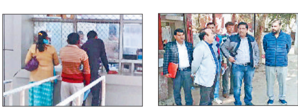
नारनौल। काउंटर पर दवाइयां लेते मरीज व अस्पताल का निरीक्षण करते सिविल सर्जन।